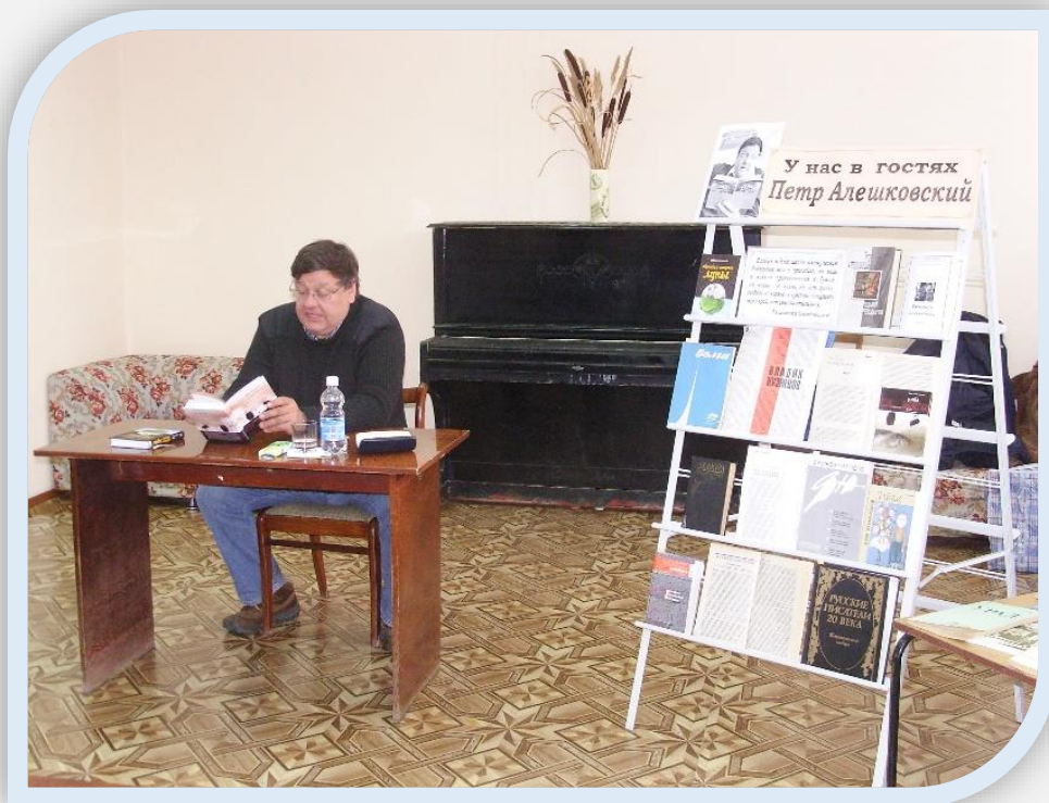
Встреча с Петром Марковичем Алешковским, известным российским писателем (г. Москва)