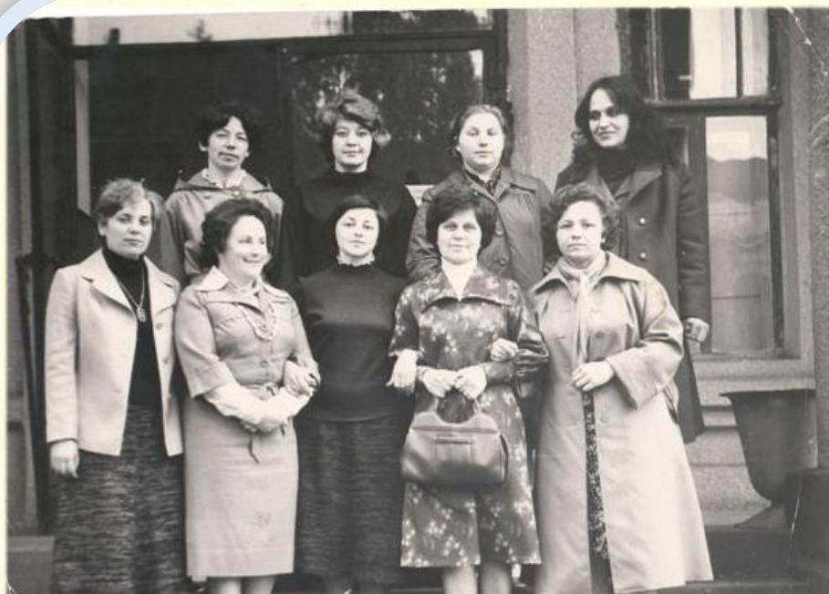
Коллектив центральной библиотеки (1981 г.)