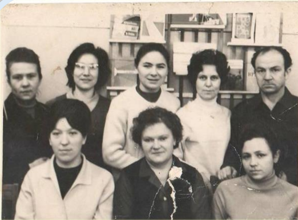
Коллектив центральной библиотеки (1971 г.)