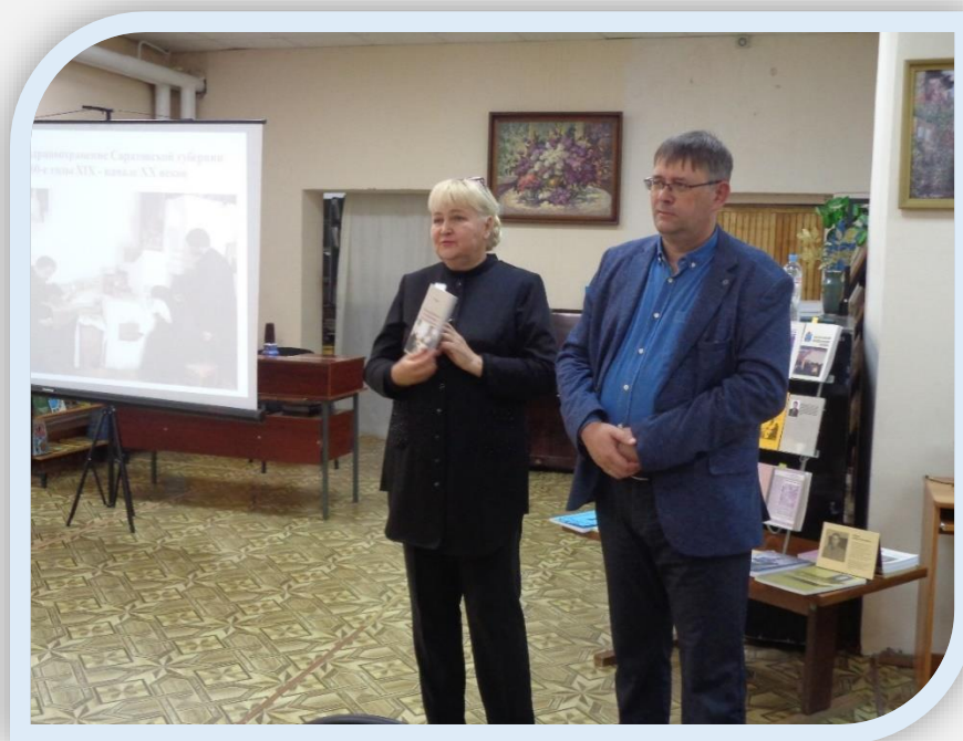
Презентация книги В.В. Назарова «Земское здравоохранение Саратовской губернии в 60-е годы XIX-начале XX вв.»