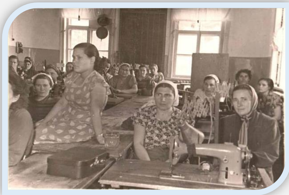
(обзор книг в швейном цехе)